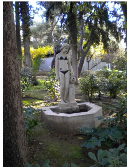
Α. Σώχος: Κοριτσάκι , 1924-30