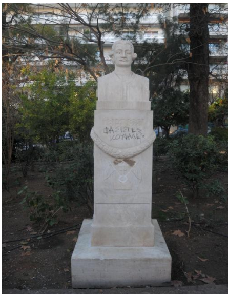
Θ. Φωμόπουλος: Εμμανουήλ Ξάνθος , 1930