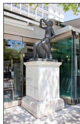
Το παιδί με τα σταφύλια