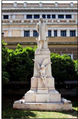
Χ. Τρικούπης, 1918