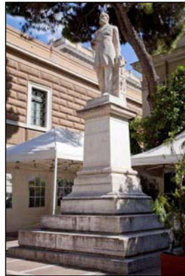
Θ. Δηλιγιάννης, 1931