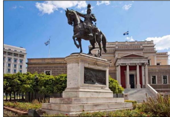
Θ. Κολοκοτρώνης, 1902