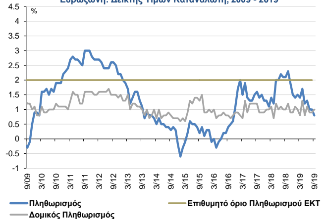
Ευρωζώνη: Δείκτης Τιμών Καταναλωτή, 2009 - 2019

Η Ευρωπαϊκή Κεντρική Τράπεζα επανέλαβε ότι τα επιτόκια της θα παραμείνουν στα τρέχοντα ή χαμηλότερα επίπεδα μέχρι να σημειωθεί διατηρήσιμη άνοδος του πληθωρισμού προς τον στόχο (πλησίον αλλά χαμηλότερα του 2%). Επισημάνθηκε η ανάγκη να εφαρμοστεί νομισματική στήριξη για παρατεταμένη χρονική περίοδο, ώστε να επιτευχθεί η ενίσχυση του πληθωρισμού από χαμηλό επίπεδο. Η ΕΚΤ αναμένει ότι η νομισματική στήριξη θα εξακολουθεί να συμβάλει στη βελτίωση των χρηματοπιστωτικών συνθηκών. Εκτιμάται ότι η ενίσχυση της απασχόλησης και οι ευνοϊκές χρηματοπιστωτικές συνθήκες θα υποστηρίξουν την οικονομική ανάπτυξη.