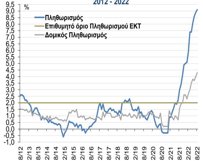
Ευρωζώνη: Δείκτης Τιμών Καταναλωτή 2012 - 2022

Η ΕΚΤ αναμένει ότι θα συνεχίσει τις εμπροσθοβαρείς αυξήσεις επιτοκίων στις επόμενες συσκέψεις, θεωρώντας ότι θα συμβάλουν στη σταδιακή αποκλιμάκωση του πληθωρισμού προς το 2% μεσοπρόθεσμα. Ανέφερε ότι η νομισματική πολιτική δεν είναι προδιαγεγραμμένη, αλλά θα καθορίζεται ανά σύσκεψη με βάση την εξέλιξη των οικονομικών συνθηκών. Η ΕΚΤ αναθεώρησε ανοδικά τις προβλέψεις για τον πληθωρισμό την περίοδο 2022-2024, ωστόσο προσδοκά ότι σταδιακά θα φθίνει η επίπτωση ορισμένων από τους παράγοντες που έχουν τροφοδοτήσει τον πληθωρισμό, που σε συνδυασμό με την περιστολή της νομισματικής πολιτικής, θα συμβάλουν στην αποκλιμάκωση των πληθωριστικών πιέσεων. Επανέλαβε ότι οι πρόσοδοι από τίτλους του χαρτοφυλακίου της που λήγουν (APP), θα επανεπενδύονται στο σύνολό τους μακροπρόθεσμα και για όσο χρειαστεί προκειμένου να διατηρηθούν συνθήκες άπλετης ρευστότητας. Οι πρόσοδοι από τίτλους του χαρτοφυλακίου της ΕΚΤ που λήγουν, που είχαν αγοραστεί εκτάκτως (PEPP), στην προσπάθεια αντιμετώπισης της πανδημίας θα επανεπενδύονται τουλάχιστον μέχρι το τέλος του 2024.