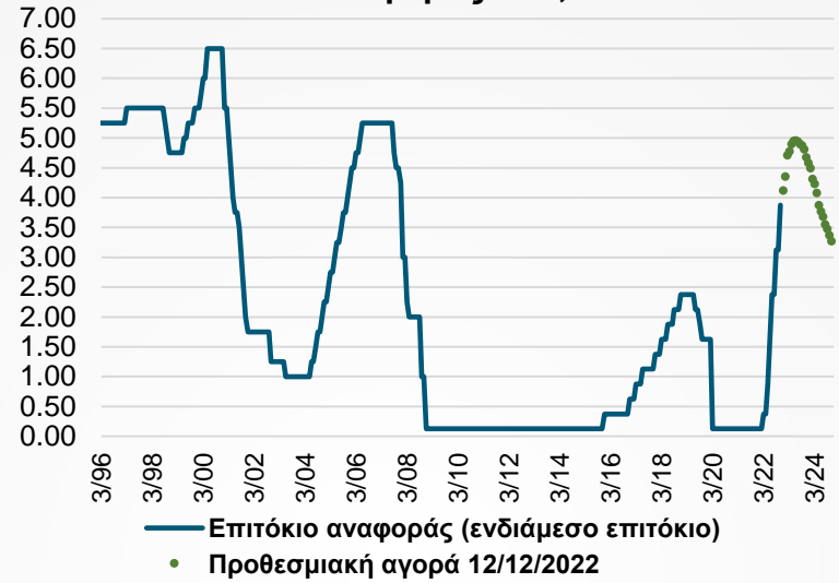
Επιτόκιο αναφοράς Fed, 1996 - 2024