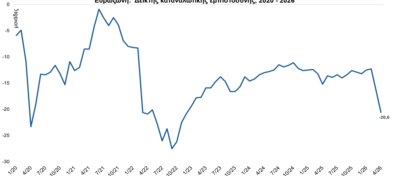
Ευρωζώνη: Δείκτης καταναλωτικής εμπιστοσύνης, 2020 - 2026

▶ Στην Ευρωζώνη ο δείκτης καταναλωτικής εμπιστοσύνης Απριλίου παρουσίασε επιδείνωση μεγαλύτερη των εκτιμήσεων και υποχώρησε σε χαμηλό από τον Δεκέμβριο του 2022 (-20,6, εκτίμηση: -17,2, Μάρτιος: -16,4).