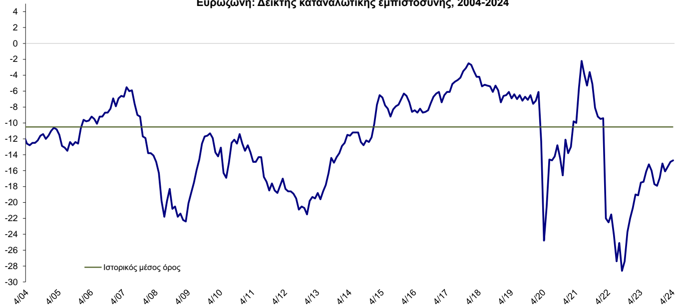
Ευρωζώνη: Δείκτης καταναλωτικής εμπιστοσύνης, 2004-2024

► Σύμφωνα με την αρχική μέτρηση, ο δείκτης καταναλωτικής εμπιστοσύνης στην Ευρωζώνη παρουσίασε τον Απρίλιο βελτίωση σε υψηλό (-14,7, Μάρτιος: -14,9) από τον Φεβρουάριο του 2022, καταδεικνύοντας ανάκαμψη της κατανάλωσης.